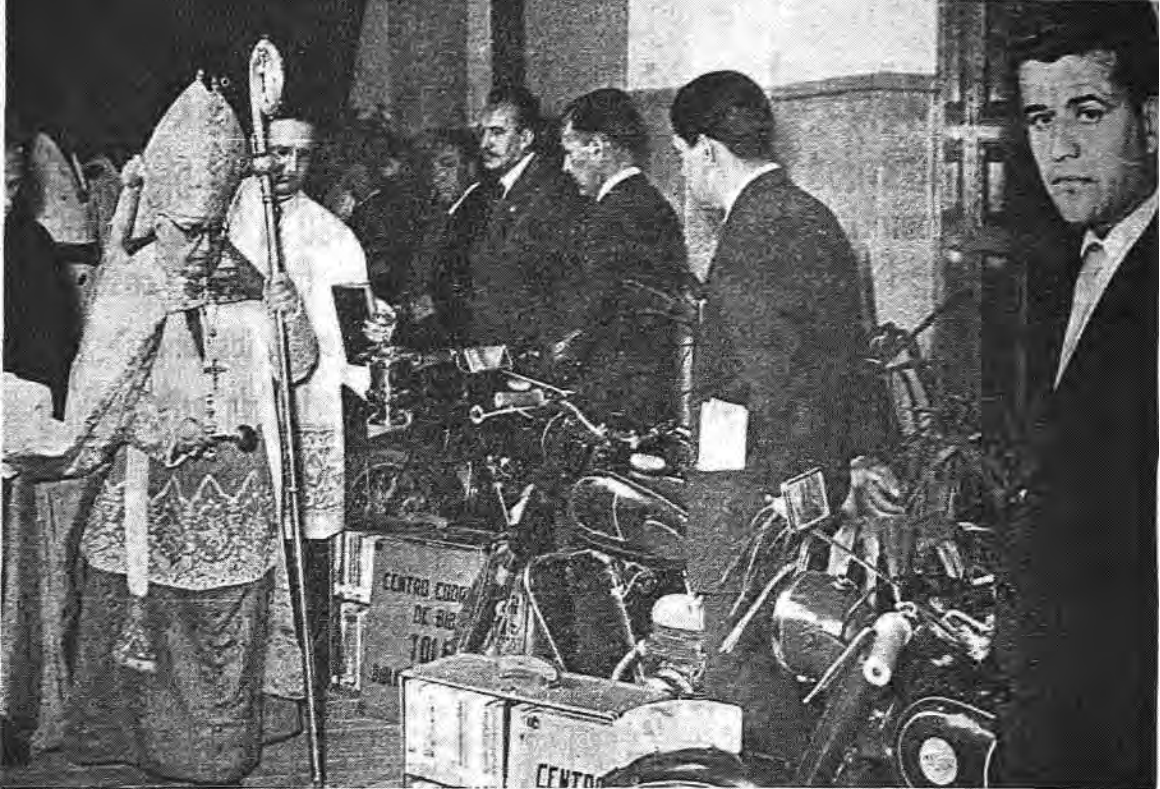
La Diputación de Toledo muestra con orgullo legítimo su Servicio de Maestros Rurales Motorizados, primero de este tipo que se organiza en España. En la foto, el Emmo. y Rvdmo. Sr. Cardenal Pla y Daniel bendiciendo las motocicletas y las Bibliotecas viajeras que se les entregó con ocasión del Día de la Diputación en 1957.

que se iniciaba había de tener carácter de ensayo que permitiese formar en lo sucesivo planes más extensos y eficientes. La experiencia alcanzada, aun con los defectos y vacilaciones inherentes a toda obra que empieza, permite, sin embargo, asegurar que la necesidad era apremiante, que el problema existía y que el medio ideado era capaz e idóneo para resolverlo.