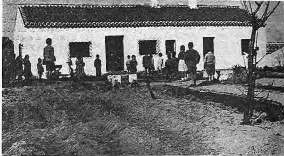
Una Escuela del Servicio.

cuela más cercana, a 6 kilómetros; alumnos, 14; Maestro, D. Nicolás Avila Cirici.