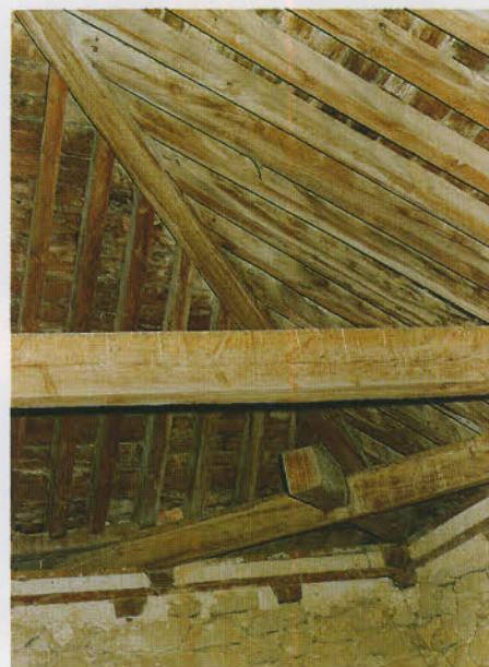
Techumbre de madera correspondiente a la Iglesia de Santiago, realizada artesanalmente en su construcción durante los siglos XV y XVI.

dorados colocados en el segundo arco con estatuas de San Antonio y San Sebastián. A los pies de la iglesia está el coro con su verja de madera toda de color negro y dorado y en él un órgano con barandillas color de caoba. Tiene esta iglesia su sacristía y contigua a aquélla un cuarto que sirve de caílo".