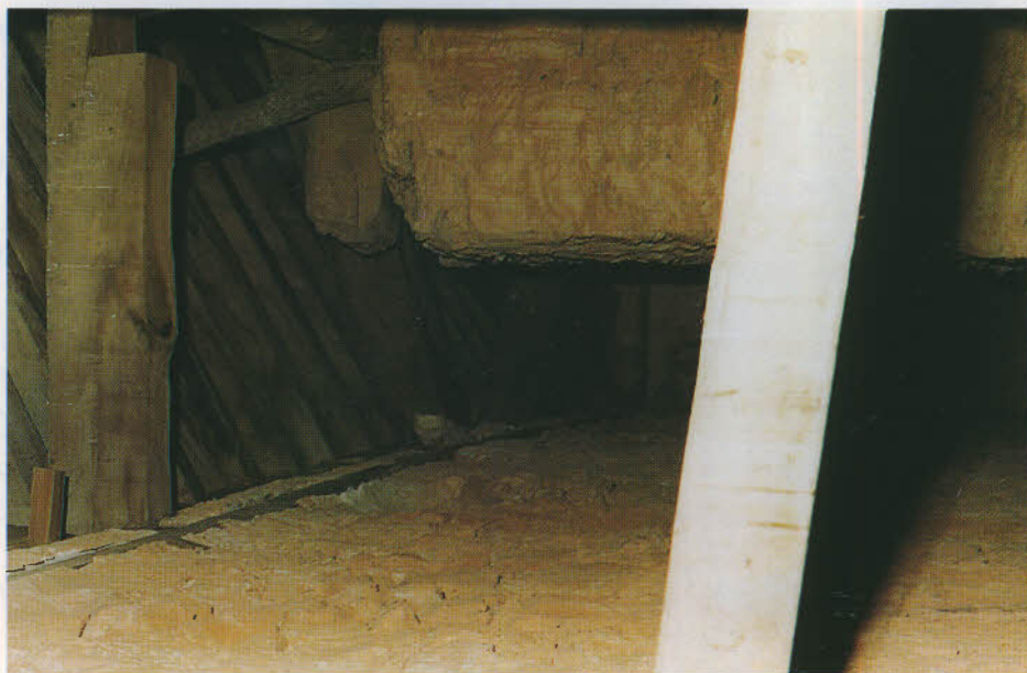
Interior de la parte superior de la cúpula central de la Iglesia de Santiago.

También visitaron la iglesia de San Miguel los mismos peritos que inspeccionaron la otra parroquia. Su fábrica era de "piedra arena, y la torre lo mismo, con su arco de adorno por remate, tres campanas y un cimbelillo corriente. Dos entradas principales a mediodía y norte, en forma de arco; sus puertas de pino, clavazón de rosetas, enrasado rehundido; cancelas de la misma madera con cerraduras, fallabas, pasadores y picaportes, dadas las maderas de color caoba. En lo interior tiene su púlpito de hierro, dado de verde y morado, tornavoz de pino tallado y dorado, y de lo mismo el altar mayor y sus colaterales. Suelo holladero de yeso. Bóveda de tres naves con sus bóvedas de piedra y yeso sobre columnas y arcos de piedra, con noventa y seis pies de longitud y setenta de latitud y altura. A la izquierda del altar mayor hay una capilla que se venera Nuestra Señora de los Sábados, con su media naranja golpeada de tallo dorado, con su tabernáculo que hace a tres altares y mesas de madera,