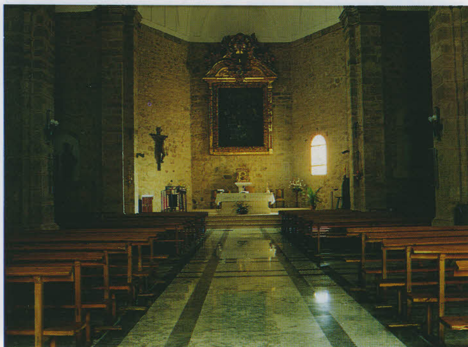
Iglesia de San Miguel, restaurada en el año 1992.

Además de lo reseñado eran propiedad de la encomienda una huerta para hortaliza en la parte llamada Valle de la Fuente Dulce, con noria, teniendo derecho a quince horas de riego con el sobrante de la fuente susodicha y el de otra noria más abajo, junto al molino de aceite; un alcacer o herreral al lado de las eras y del camino que iba del Arrabal a San Antón y otro que salía de la Fuente de los Caños; unas olivas y una dotación de ciento veinticinco reales de vellón que para la función del Corpus Cristi le proporcionaba el Concejo.