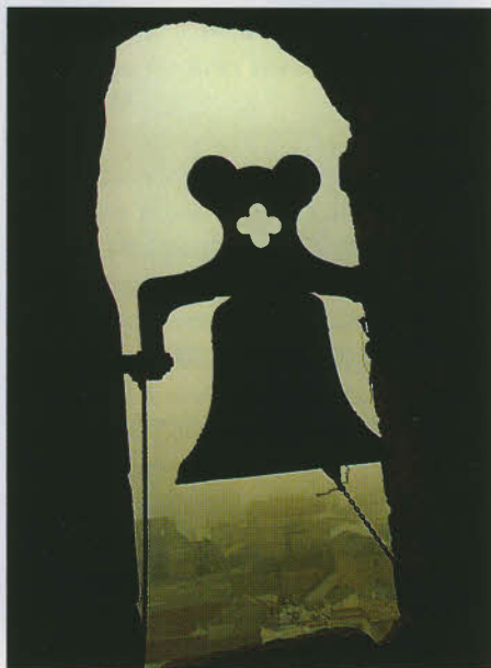
Campanario de la Iglesia de Santiago.

diecisiete de ancho con su dos postigos a los lados y formado de dos puertas, su falleba, pasadores y picaportes. Al lado que mira al cierzo hay puerta en arco de piedra arenisca almohadillado de quince pies de alto y nueve de ancho, en construcción a toda moldura de arquitrabe, con sus dos postigos y dos cruces de Santiago en dos conchas en el zócalo de arriba de los postigos color caoba y herraje correspondiente. Un cancel de dieciocho pies de alto y trece de ancho de la misma madera, color y forma que la anterior. Esta iglesia es de tres naves de orden toscano, con arcos de piedra arenisca descubiertos, la bóveda de yeso y las paredes de sillar labrado en llano de piedra arenisca y suelo olladero de yeso; cornisa de dicha piedra; tres pilas de agua bendita de piedra mármol y la del bautismo de piedra arena. Su largo del cuerpo de iglesia, ciento veintitrés pies, setenta y nueve de ancho y lo mismo de alto. La capilla mayor forma un cubillo con su retablo mayor dorado y jaspeado y dos colaterales con sus retablos dorados y mesas de altar de madera jaspeada. El púlpito con escalera y antetecho, aquélla de madera y ésta de hierro con su tornavos torneado y dorado. Dos adornos