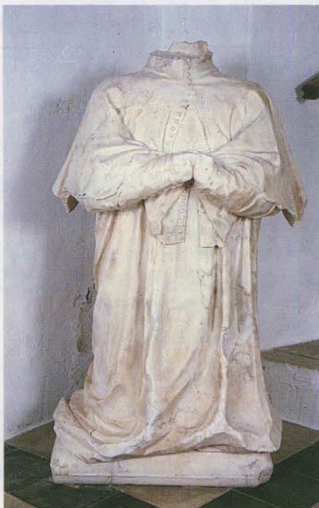
Escultura de la Iglesia de Santiago, que fue dañada durante nuestra guerra civil.