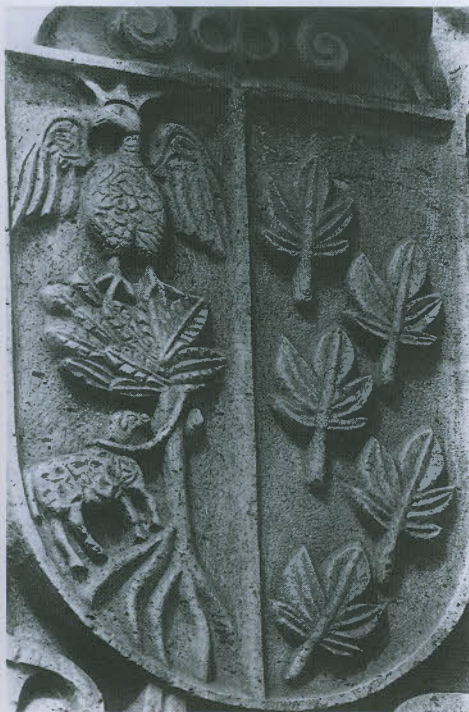
Escudo de armas de los CANO-CORDIDO en la casa de la familia Gómez Rodríguez Monge. Sólo el cuartel izquierdo.

En nuestra Villa fueron hacendados, caballeros de Santiago, presbíteros,