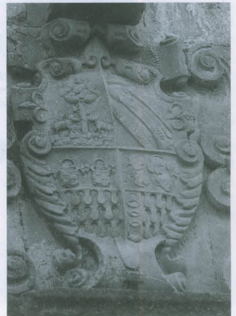
Armas de los CANO-CORDIDO en la actual Caja Castilla-La Mancha. Solo el Cuartel del árbol y los dos corderos.