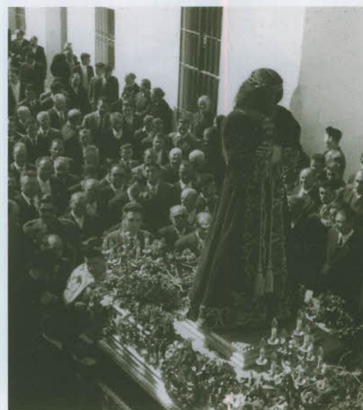
Procesión de Jesús Nazareno.