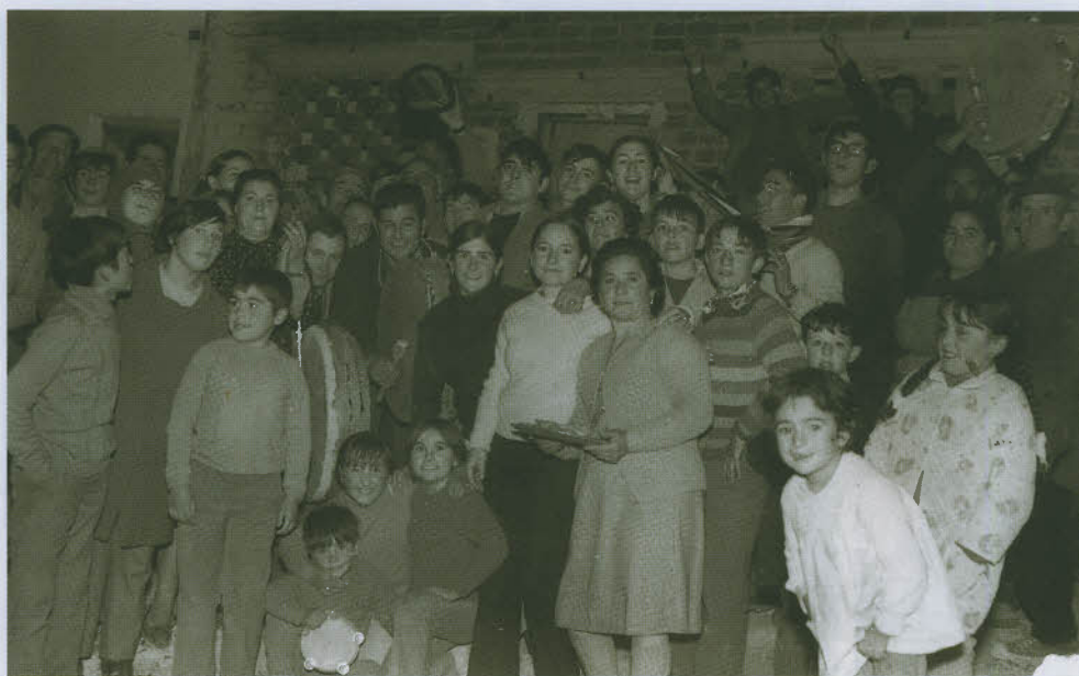
Belén de los Candiles. Año 1972