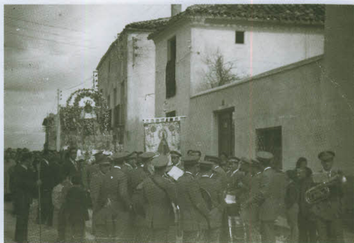
Procesión de Ntra. Sra. Virgen del Rosario