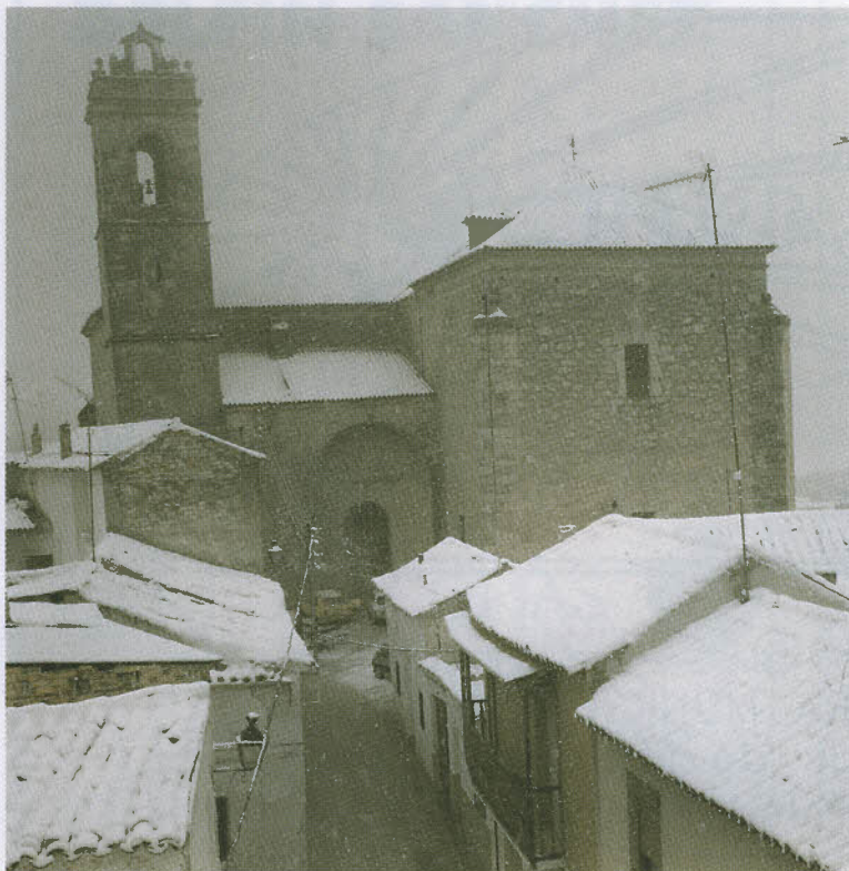
Calle e Iglesia de San Miguel Nevando, Enero 1997