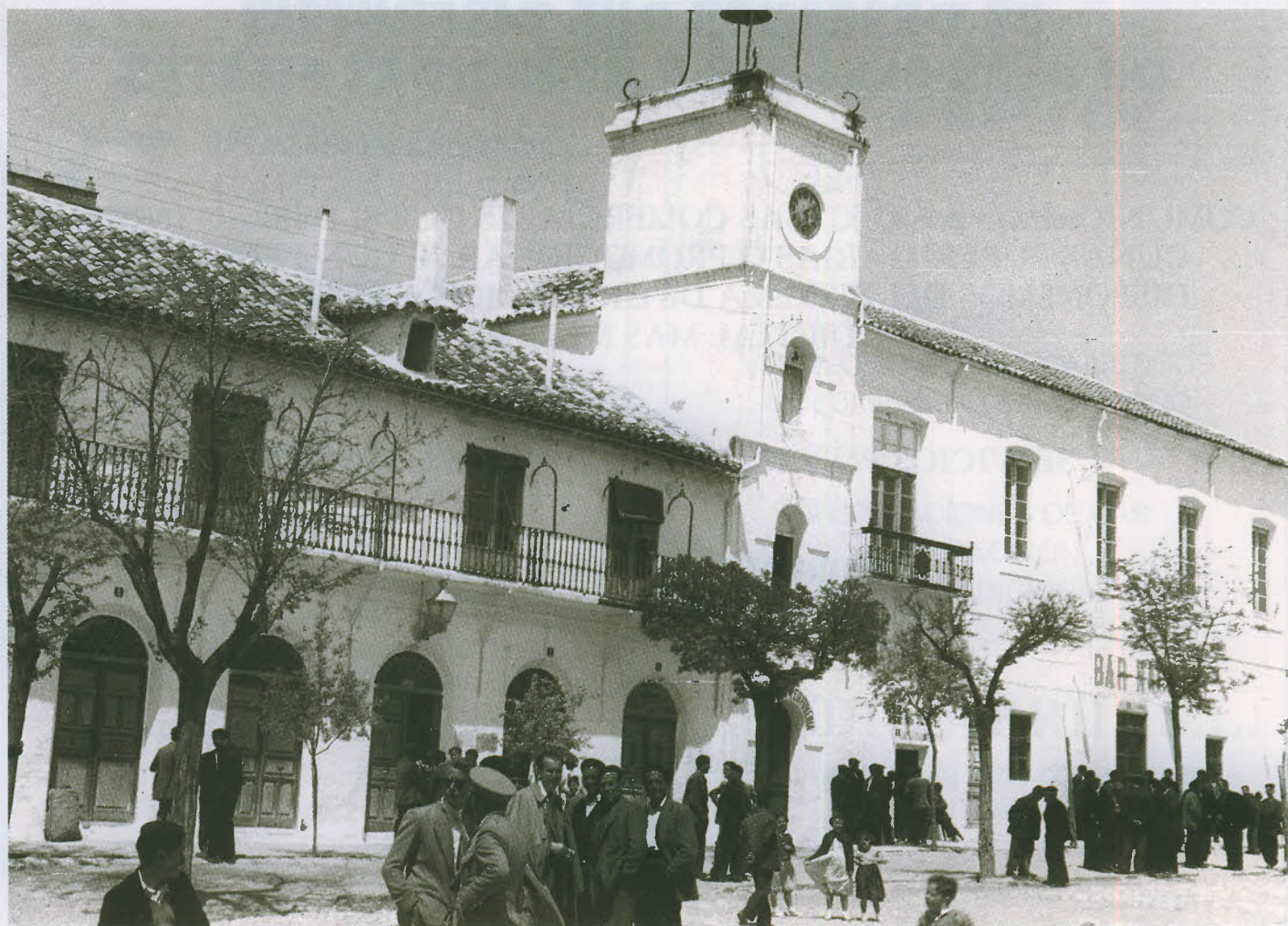
Plaza de la Constitución años 50