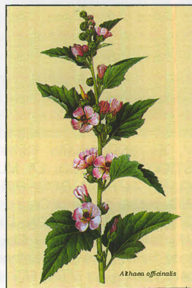
Foto nº 1. Malvasisco

tura e Industria para que cada una de ellas nombren dos personas, que juntas, examinen este expediente y le informen.