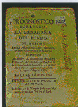
[24], 40 p.; 8° (16 cm).

El libro, tal y como aparece en la anterior referencia bibliográfica, está dividido en dos partes,